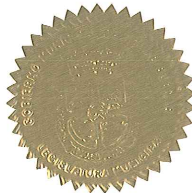
LUÍS ARROYO CHIQUÉS ALCALDE

APROBADA Y FIRMADA POR EL HONORABLE LUÍS ARROYO CHIQUÉS, ALCALDE DE AGUAS BUENAS, PUERTO RICO, EL DÍA 31 DE MAYO DE 2013.