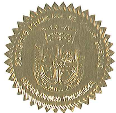
LUIS ARROYO CHIQUÉS ALCALDE

APROBADA Y FIRMADA POR EL HONORABLE LUÍS ARROYO CHIQUÉS, ALCALDE DE AGUAS BUENAS, PUERTO RICO, EL DÍA 17 de Mayo de 2015.