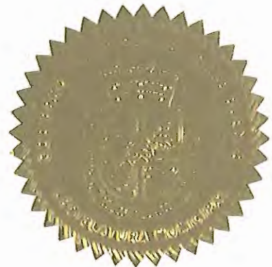
LUÍS ARROYO CHIQÜÉS ALCALDE

APROBADA Y FIRMADA POR EL HONORABLE LUÍS ARROYO CHIQÜÉS, ALCALDE DE AGUAS BUENAS, PUERTO RICO, EL DÍA 21 DE SEPTIEMBRE DE 2012.